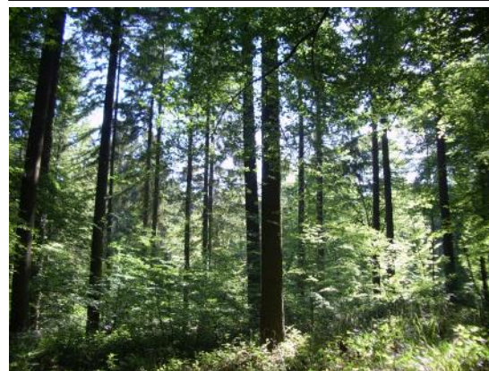
Peuplement de douglas arrivé à maturité qui sera renouvelé en chêne en 2031

NATURA 2000 : Le réseau Natura 2000 rassemble des sites naturels ou semi-naturels de l'Union Européenne ayant une grande valeur patrimoniale par la faune et la flore qu'ils contiennent. L'objectif est d'y maintenir la diversité biologique des milieux, dans une logique de développement durable.