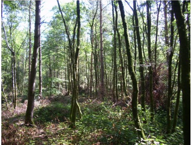
peuplement de perches et de taillis de feuillus et résineux (parcelle 31)