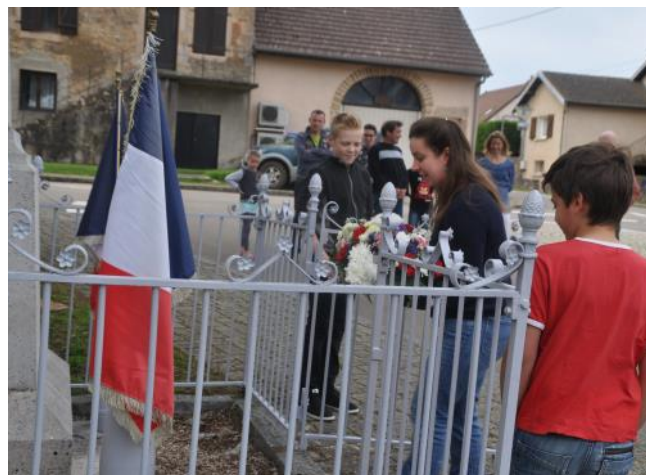
Jeunes et anciens ont rendu hommage à la Résistance.