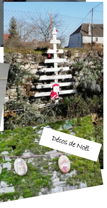
Décos de Noël