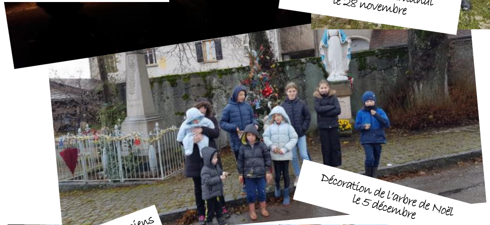
Décoration de l'arbre de Noël le 5 décembre