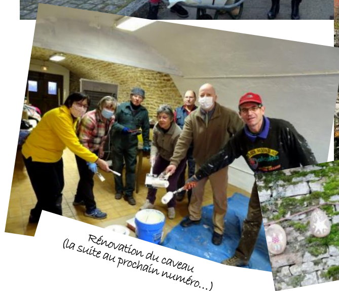
Rénovation du caveau (la suite au prochain numéro...)