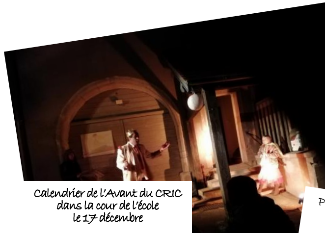
Calendrier de l'Avant du CRIC dans la cour de l'école le 17 décembre