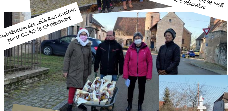
Distribution des colis aux anciens par le CCAS le 17 décembre