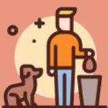
Picto Darius Dan

Le Maire a été de nouveau interpellé par des habitants au sujet des déjections canines dans le village. C'est un problème récurrent qui concerne la responsabilité des propriétaires de chiens et c'est à eux de veiller à ce que les chaussées, les accotements, le terrain communal ne deviennent pas des toilettes publiques canines. Pour cela, il n'y a qu'une seule solution, ramasser les déjections. Des affiches seront placées aux endroits les plus signalés par les riverains. Merci à tous de respecter cette règle de bien vivre ensemble.