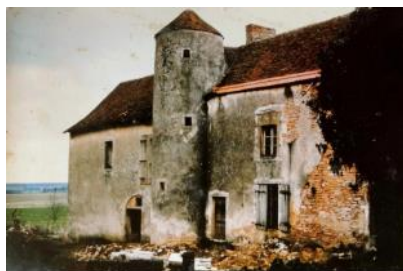
En 1975, avant les travaux