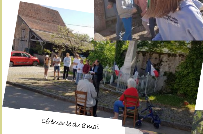
Cérémonie du 8 mai