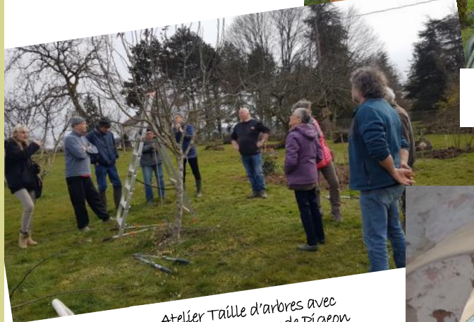
Atelier Taille d'arbres avec l'association Coeur de Pigeon