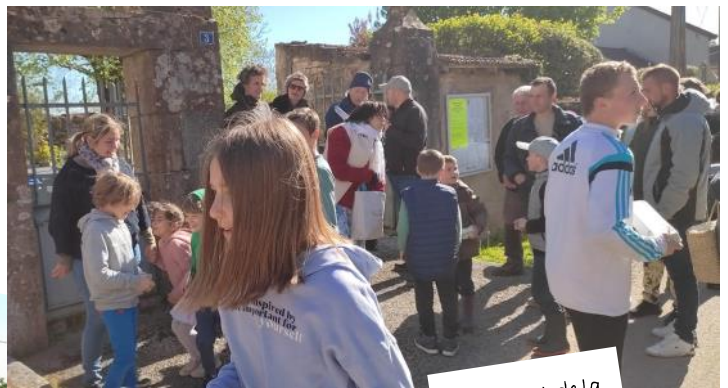
Au départ de la chasse aux oeufs