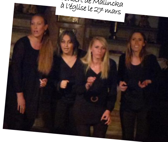
Concert de Malinka à l'église le 27 mars