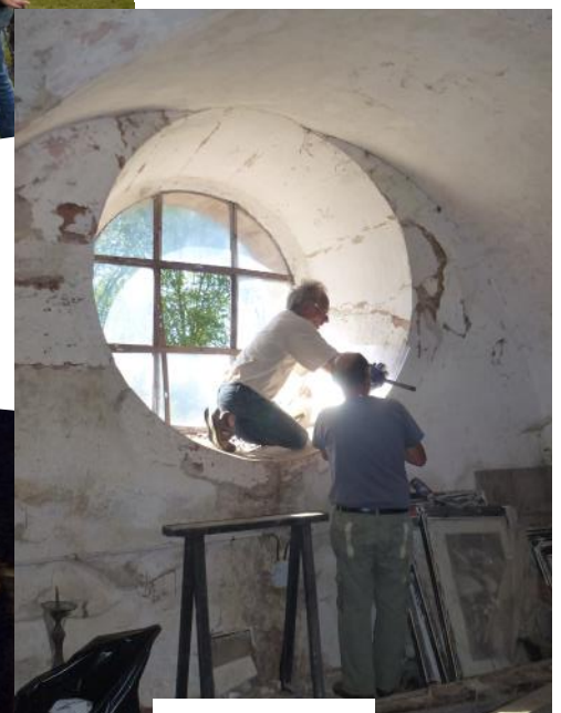
Travaux à l'église