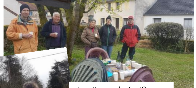
Le nettoyage du cimetière, une bonne chose de faite !