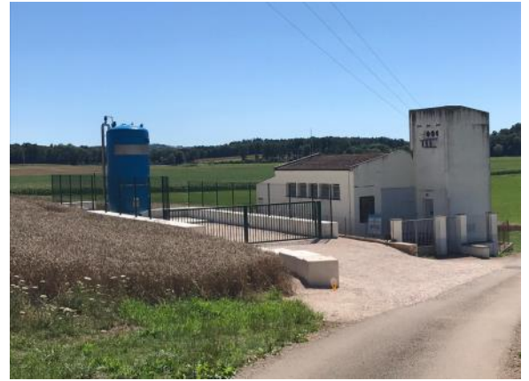
La nouvelle plateforme accueillant le filtre dans la station de captage de Thervay.

Le Syndicat des eaux prévoit l'organisation d'une journée Portes ouvertes en septembre.