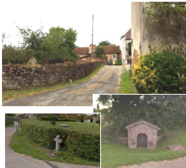
Quelques éléments du patrimoine remarquable de Frasné